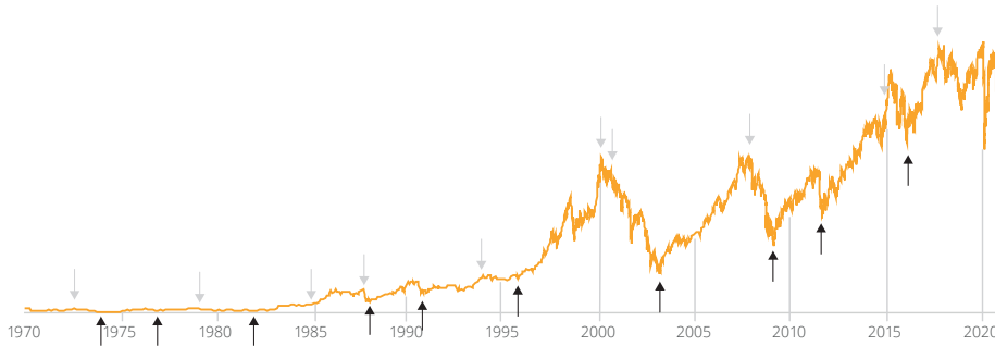
Die Kursentwicklung des DAX Index über die letzten 51 Jahre