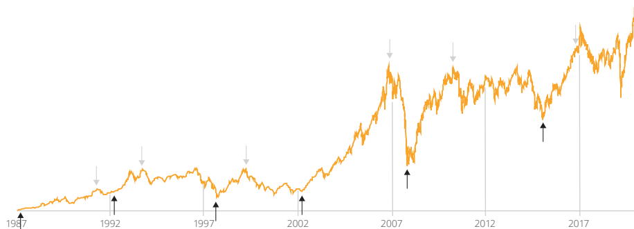
Die Kursentwicklung des MSCI Emerging Markets Index über die letzten 33 Jahre