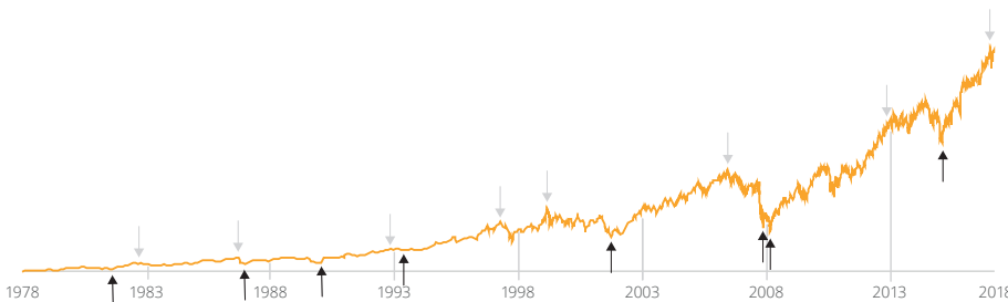
Die Kursentwicklung des Russell 2000 Index über die letzten 41 Jahre