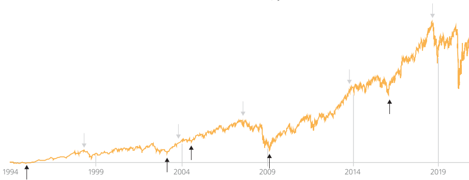
Die Kursentwicklung des S&P 600 Index über die letzten 27 Jahre