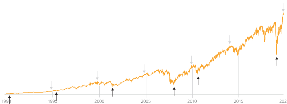
Die Kursentwicklung des S&P 400 Index über die letzten 30 Jahre