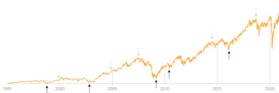
Die Kursentwicklung des MSCI Small Cap Index über die letzten 26 Jahre